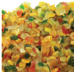
цукаты в ассортименте