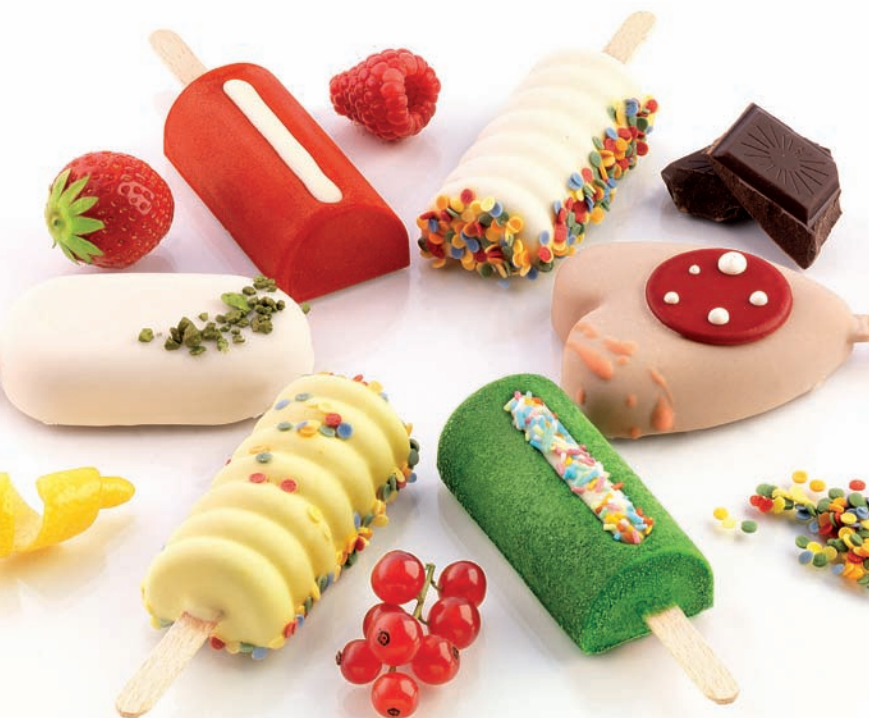
Подставки для эскимо

Формочки, палочки и подставки для эскимо, самые разнообразные креманки, а также силиконовые и пластиковые формы для тортов – все это можно приобрести в компании “Италика-Трејдинг”.